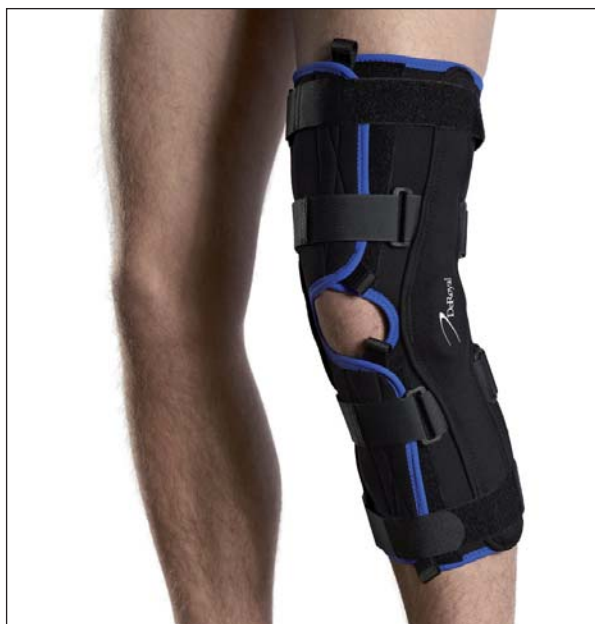
EU4019 GENUM LIGA ROM EASE LONG NEOTEX EU4119 GENUM LIGA ROM EASE LONG TRITEX

En vidareutveckling av modellerna EU4010/ EU4110. Modellen är helt öppningsbar framtill för att förenkla applicering vid exempelvis post-operativt bruk. Leden är tillverkad av en rostfri stållegering vilket gör den helt underhållsfri och helt korrosionsbeständig. Möjligheten till rörelseinskränknings i extension 0, 10, 20, 30 grader och flexion 60, 75, 90 grader har kompletterats med möjlighet till immobilisering i 0, 20, 40 och 60 grader. Detta gör att ortosen passar för begränsade post-op behov. Ledjusteringen görs med en pin som sedan förankras med ett plastlock. Skenfickan har förbättrats för att den nya skenan ska vara helt inkapslad för optimal komfort och funktion. Öppningen för skenan sitter baktill på den övre delen av fickan. Det gör att den sitter säkert under aktivitet men enkelt kan tas ur vid behov. Ortosen har fyra halvcirkulära band som appliceras individuellt för stöd vilket ger en mycket bra stabilitet. Justerbara kardborrband upptill och nedtill på ortosen. INDIKATIONER Post-Operativt efter knäoperation, ACL eller PCL skador, kollateralligamentsskador, meniskskador.