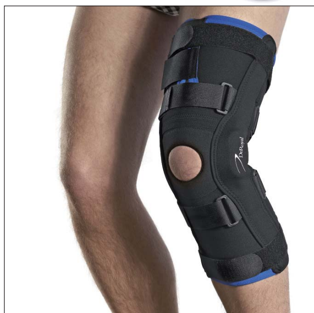
EU4010 GENUM LIGA ROM LONG NEOTEX EU4110 GENUM LIGA ROM LONG TRITEX