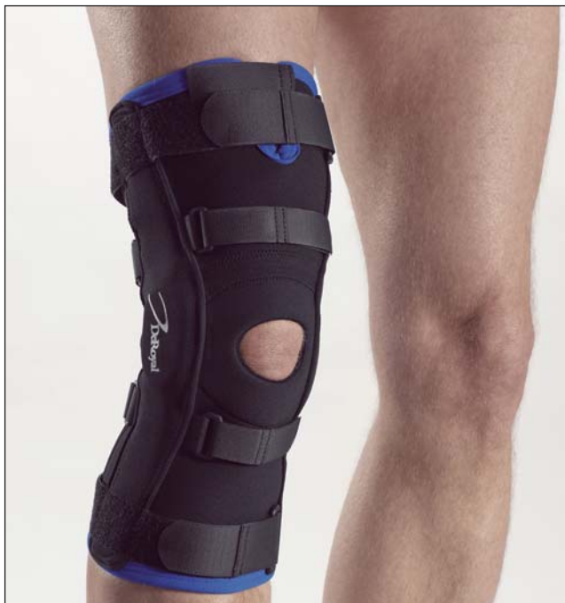
EU4009 GENUM LIGA ROM SHORT NEOTEX EU4109 GENUM LIGA ROM SHORT TRITEX