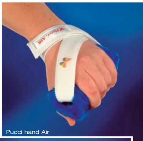
Pucci hand Air