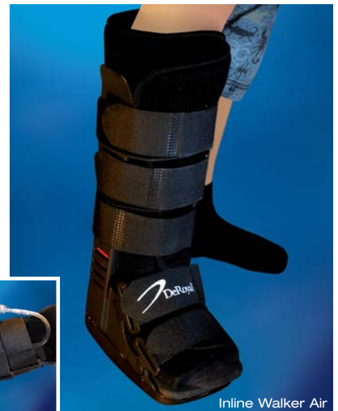
Inline Walker Air