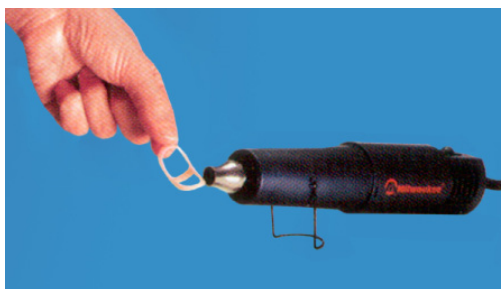
Värm i intervaller om 3-5 sekunder för att undvika överhettning. Undvik att värma direkt mot bandet på ringen.