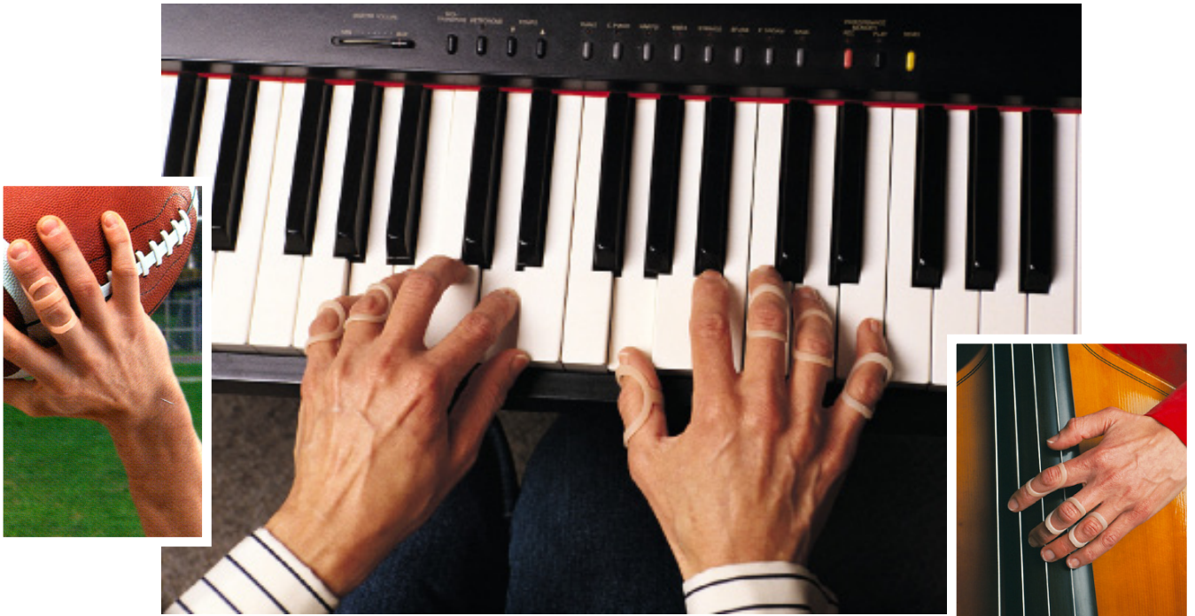
Oval 8-fingerring är lätt att anpassa, lätt att bära utan inskränkande funktion och håller många år.

O val 8-fingerringar stabiliserar, avlastar och korrigerar fingrarnas IP-leder för en förbättrad handfunktion. Dels genom sin unika banddesign och med både en hel och halvringstorlek i en och samma ring, beroende på vilken sida av Oval 8-ringen som först placeras på fingret. Ringarna används för att korrigera Svanhalsdeformitet, Bouttonniere och Malletfinger. Oval 8 fingerringar reducerar Lateraldeviation av fingret och avlastar vid